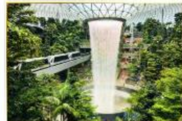
• HSBC Rain Vortex