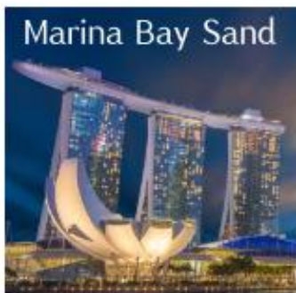
Marina Bay Sand

นำท่านเดินทางสู่ สิงคโปร์ มีชื่ออย่างเป็นทางการว่า สาธารณรัฐสิงคโปร์ เป็นนครรัฐสมัยใหม่และเป็นประเทศที่เป็นเกาะขนาดเล็กที่สุดในเอเชียตะวันออกเฉียงใต้ ประเทศบนเกาะเล็กๆ แต่มากด้วยความเจริญทางเศรษฐกิจ ที่รวบรวมความหลากหลายทางวัฒนธรรมและความทันสมัยได้อย่างลงตัว ถึงแม้สิงคโปร์จะมีพื้นที่ใช้สอยค่อนข้างจำกัด แต่นี่ก็กลับมีแหล่งท่องเที่ยวสวยๆ มากมายไว้คอยให้ผู้คนจากทุกสารทิศได้ไปเที่ยวและพักผ่อนกัน และด้วยความสวยงามอลังการของสถานที่ท่องเที่ยว